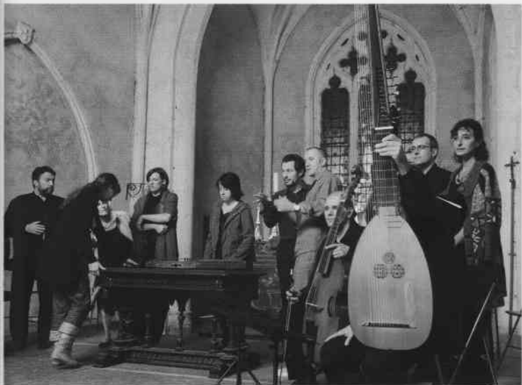
Sur le tournage de Tous les soleils , long métrage de Philippe Claudel, produit par UGC YM.

plique Marie-Alix Fourquenay. Il est vrai que les chiffres sont parlants : 620 m de long, 35 m de large, 90 m de dénivelé et un tapis neigeux de 60 cm maintenu à une température de -2^{\circ}\text{C}/-3^{\circ}\text{C} ! La possibilité de tourner des scènes d'action dans un tel décor, sur fond bleu par exemple, n'a pas manqué d'intéresser certains scénaristes.