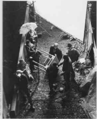
Tournage en Lorraine de The Hunters .

(1) : Toutes les années impaires, le Mondial Air Ballons organise un gigantesque événement avec, pour l'édition 2009, plus de 300 montgolfières, dans le ciel messin. Cette rencontre se situe à la sixième place des manifestations les plus importantes de France.